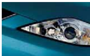
Azul Marinho (32C)