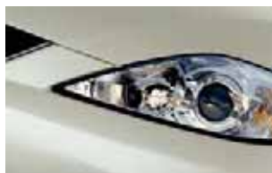
Cinza Platinum (22R)