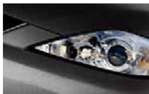
Cinza Galaxy (32S)