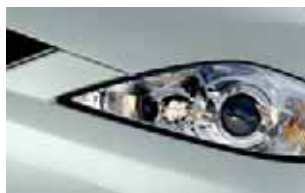
Cinza Stellar (32B)