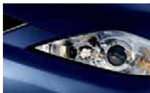
Azul Escuro (25E)