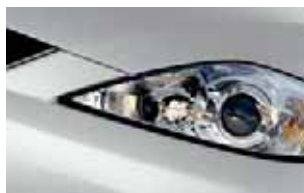
Cinza Prata (22V)